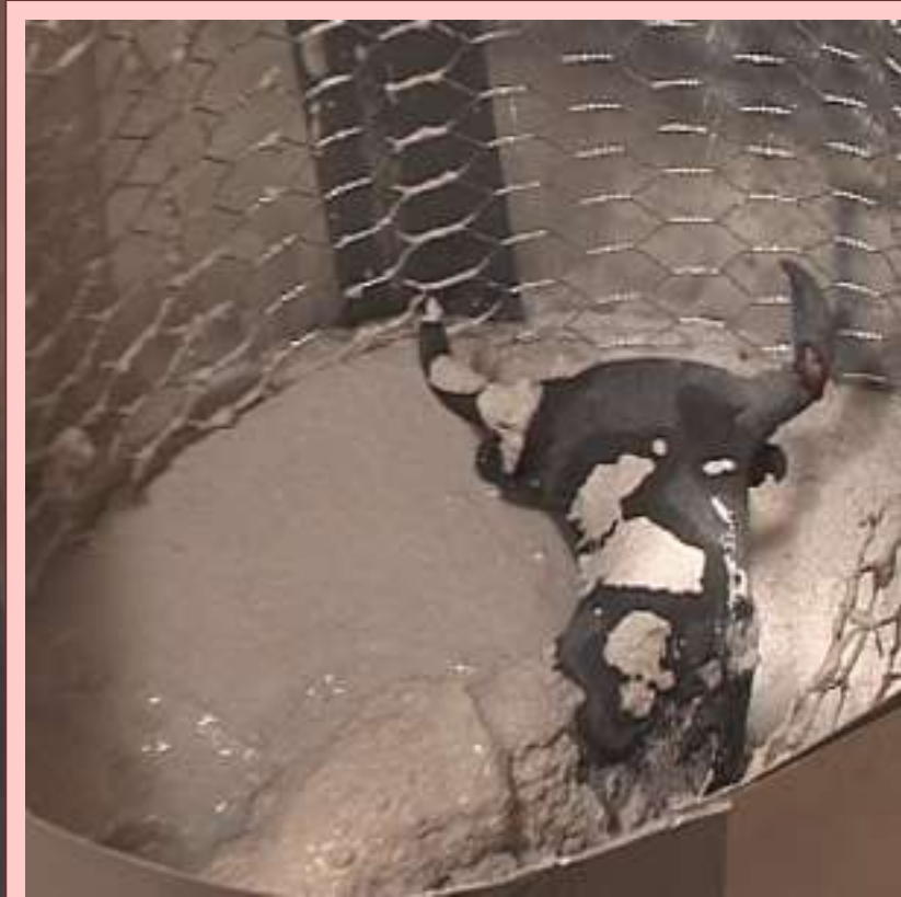
Muotin täyttö puolivälissä