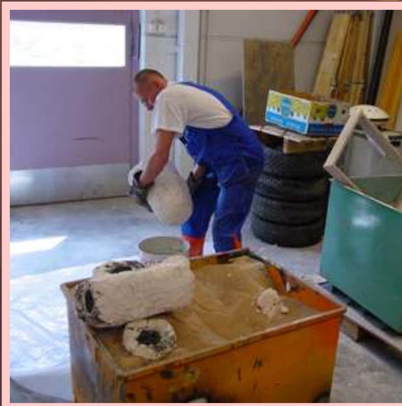
Muotit pois hiekasta