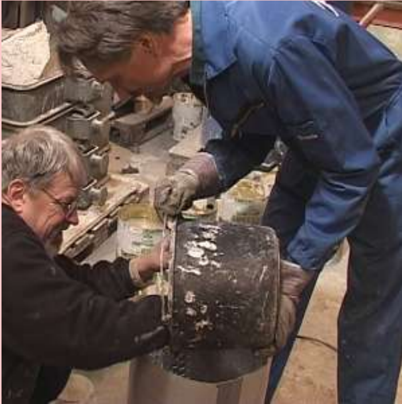
Muotin täyttö muottimassalla