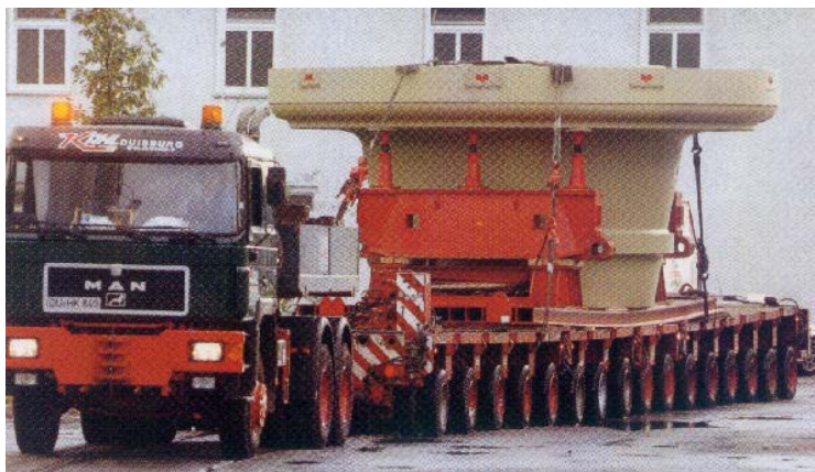
Kuva: Pallografiittivalurautainen 195t painava sementtijauhimen osa 16-akselisella erikoiskuljetusalustalla.