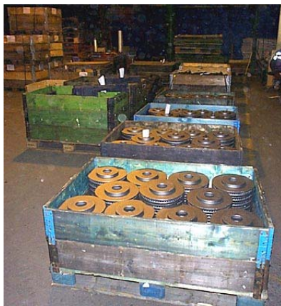
Kuva: Valmiita valukappaleita odottamassa kuljetusta asiakkaalle.