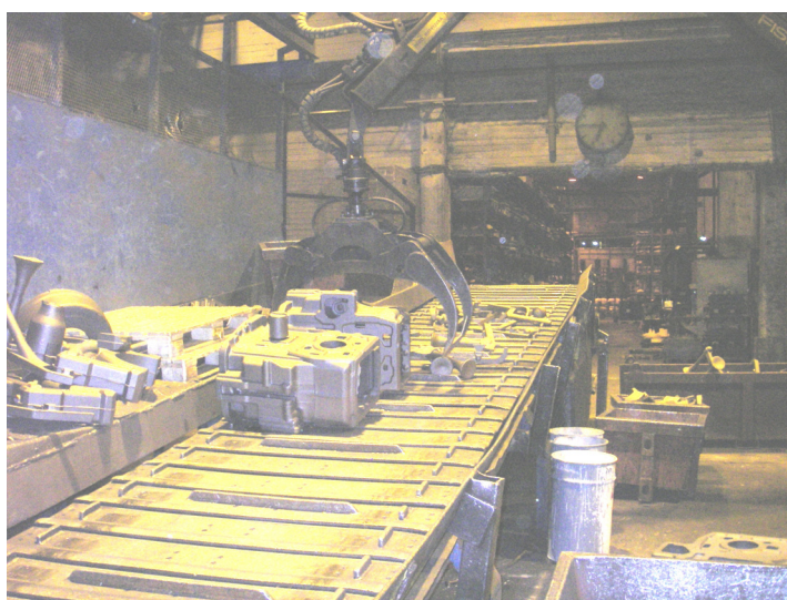
Kuva 465. Valunpuhdistuslinja