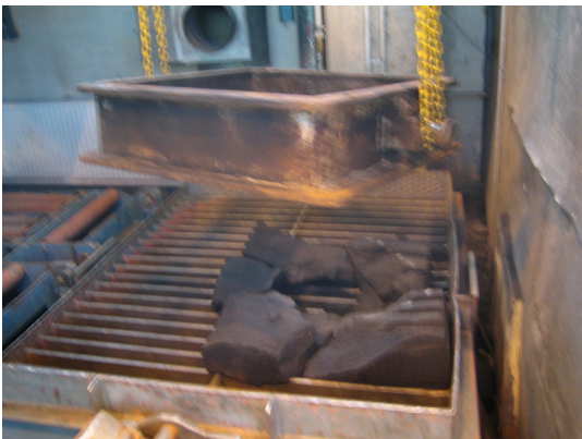
Kuva 461. Nostetaan valukappale pois täryristikolta

Lopuksi kehät nostetaan pois täryristikolta ja kuljetetaan varastointipaikalle. Kehät voivat siirtyä myös muillakin tavoin tärypöydältä.