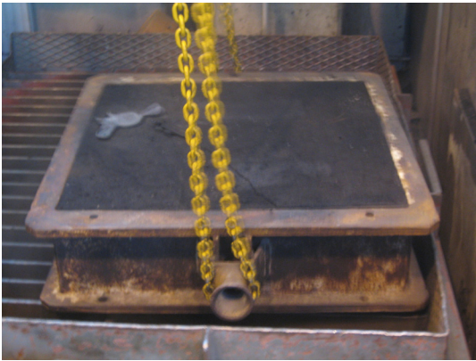
Kuva 457. Tärytyhjentimelle lasketaan muotti