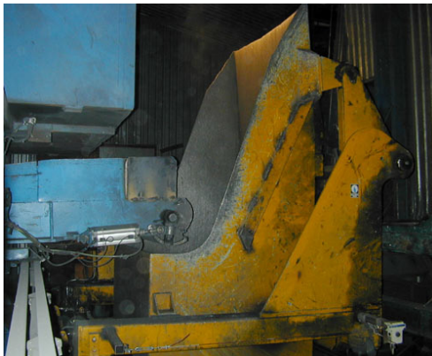
Kuva 472. Valukappaleet menevät rummun panostuskauhaan