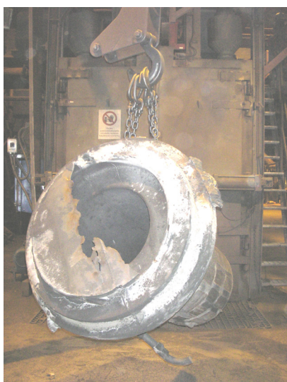
Kuva 464. Valukappale nostettu tyhjennyksestä sinkopuhallukseen menoa varten

Tyhjennyksestä valukappaleet nostetaan pois jatkokäsittelyyn valunpuhdistukseen tai ne kulkevat esim. automaattikaavauslinjoilla kuljetushihnoja pitkin.