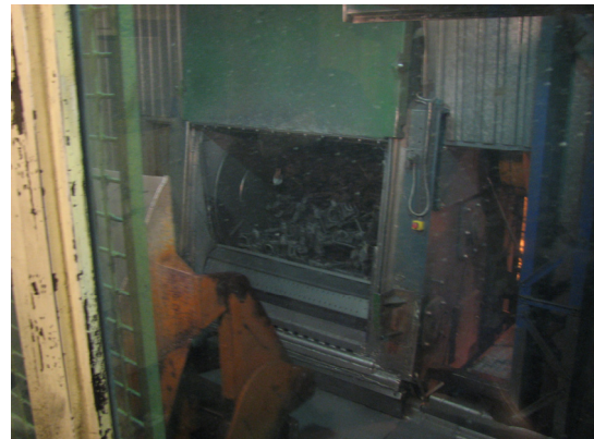
Kuva 473. Valut rummutuskoneessa