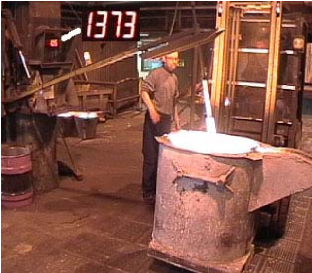
Kuva. Lämpötilanmittaus senkasta.

Lämpötilalukema on tavallisesti digitaalinen. Eräissä mittarityypeissä on muisti, joka pitää lukeman näkyvässä tietyn ajan. Lämpötilan nopeasti vaihtuessa laskee mittari lämpötilojen keskiarvon, ilmoittaa haluttaessa esiintyneet maksimi- ja miniarvot tietyn ajanjakson aikana.