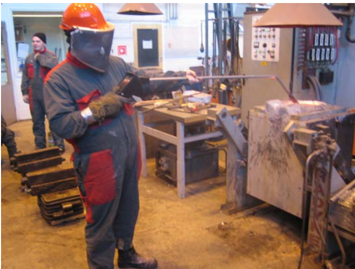
Kuva. Sulan lämpötilaa mitataan uppopyrometrillä uunista

Sulan metallin lämpötila mitataan luotettavimmin termoelementillä, jota kutsutaan usein myös uppopyrometriksi. Nimitys johtuu siitä, että osa mittalaitteesta - anturi - on mittauksen ajaksi upotettu sulaan metalliin. Termoelementissä on kupu, joka suojaa kvartsiputken kuonan kosketukselta. Kun anturi painetaan kuonan lävitse sulaan metalliin, sulaa suojakupua pois. Jos metallipinta on kuonaton, voidaan mitata ilman suojakupua. Anturilla voidaan suorittaa useampia mittauksia.