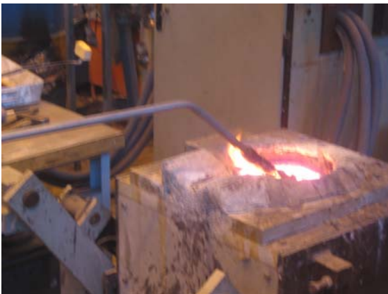
Kuva. Termoelementti sulassa

Kestävyyden kannalta on edullista, että anturia pidetään sulassa vain niin kauan kuin mittaus vaatii.